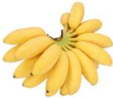
Figura 4. Plátano “dominico”

Fue también Fray Tomás el primer español que comenzó a plantar el tomate de forma intensiva. Además, fue el responsable de la agricultura organizada en el Nuevo Mundo, gracias a él se trasladaron las técnicas agrícolas de nuestro país a Centroamérica, y a él también debemos la introducción en el Viejo Continente no sólo del tomate, sino también la patata y el perejil. Por todas estas innovaciones dietéticas y gastronómicas Fray Tomás de Berlanga es considerado por muchos el patrón de la Dieta Mediterránea. Esta dieta, incorporada a nuestro lenguaje cotidiano, fue declarada, a mediados del año 2010, Patrimonio Cultural Inmaterial de la Humanidad, en denominación conjunta para España, Grecia, Italia y Marruecos (7,8) .