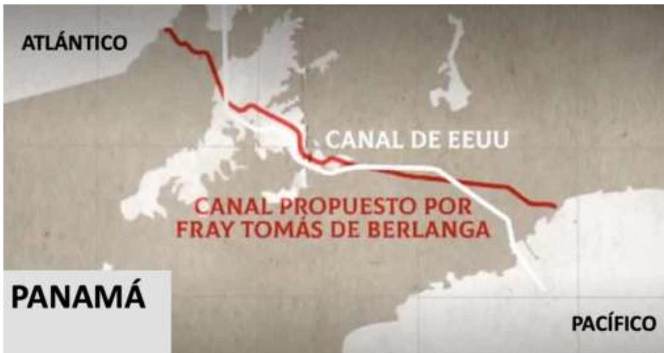
Figura 3. Proyecto de Fray Tomás y canal de Estados Unidos

Este fue el primer estudio realizado para la construcción de un canal que permitiera a los buques cruzar de un océano al otro por Panamá, y su curso seguía más o menos el del actual Canal de Panamá. Para cuando se terminó el levantamiento del mapa, el gobernador opinó que sería imposible para cualquiera lograr tal hazaña. Su idea se materializaría siglos más tarde con la obra de canalización del Chagres, y el consiguiente Canal de Panamá.