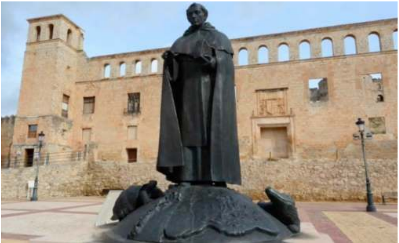
Figura 5. Fray Tomas. Al pie el recuerdo de Las Galápagos y “el Lagarto”

“Lagarto de Fray Tomás”. Se trata un caimán negro, disecado, que trajo de Panamá fray Tomás de Berlanga en 1543 y que ofreció a la colegiata de su pueblo natal. Había regresado tras una vida culminada como tercer obispo de Panamá, consejero de Carlos V, inquieto viajero y curiosa persona creativa. Hoy, el pueblo natal de fray Tomás no llega a 1.000 habitantes y casi nadie recuerda su nombre. Eso sí, pueden alojarse en el Hotel Fray Tomás. También, como curiosidad, el libro de José Javier Esparza, “Almanaque de la Historia de España”, menciona como Efemérides del 23 de febrero: 1535: Fray Tomás de Berlanga, obispo de Panamá, descubre las islas Galápagos (10) .