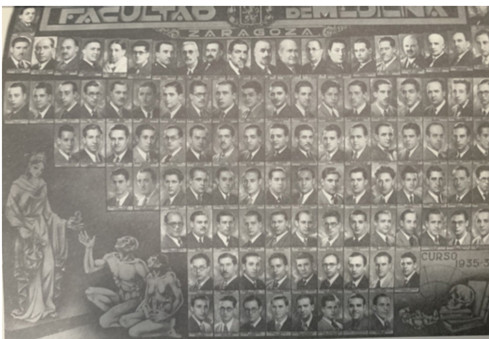
Orla de la Facultad de Medicina de Zaragoza 1936

He leído numerosos relatos acerca de la represión, tanto en la zona republicana como en la nacional, desde el de Arthur Koestler, quien en Testamento español da cumplida cuenta de las siniestras cárceles de Queipo de Llano en Sevilla, hasta los de mucha gente de derechas que pasaron