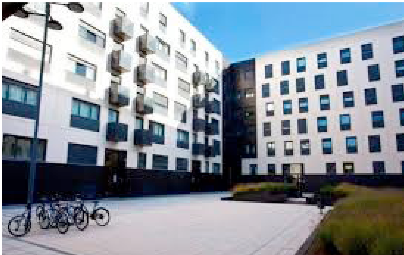
BURGOS: Calle Dra. Felisa Martínez Ruiz

la mujer y de los niños. Del 1 al 20 de junio de 1929, realizó en París, en la Maternité Baudeloque, adscrita a la Facultad de Medicina de París, un curso intensivo de práctica obstétrica.