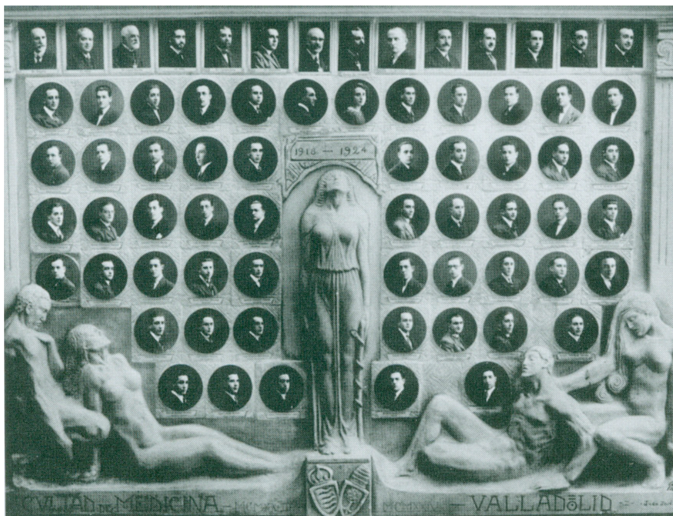
Orla de la promoción 1918-1924 de la Facultad de Medicina de Valladolid