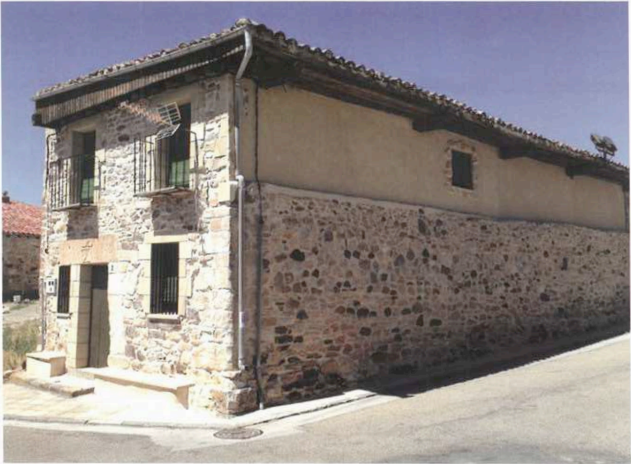
Edificio del hospital San Sebastián y detalle del dintel de la puerta