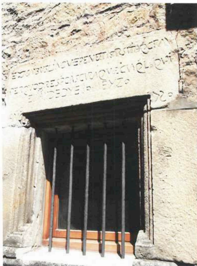
Ventana hospital de Covaleda

Hospital”, no porque hubiese sido un hospital, más bien es por el sentido de que había un lugar que ofrecía hospedaje.