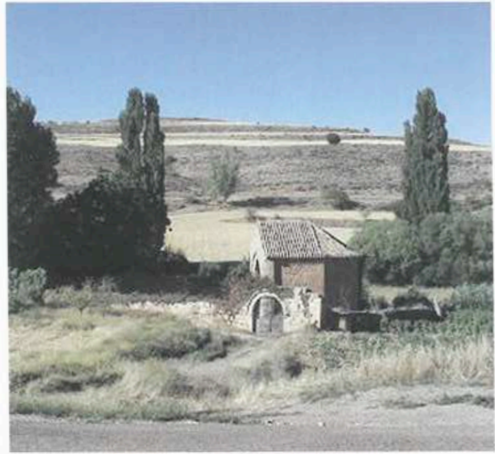
Hospital Santo Cristo

En contrapartida con este hospital de sacerdotes o peregrinos pasajeros, que gozaba de un determinado estatus social por tener una asignación económica, está el segundo hospital que carecía de recursos propios y estaba destinado a los pobres. En cuanto a su ubicación geográfica, pudiera ser que estuviera situado en la que se sigue llamando hoy en día “calle del Hospital”. En la actualidad, no existe vestigio alguno de este hospital.