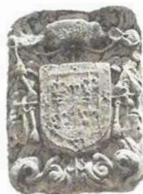
Escudo Episcopal del Hospital de Almazul