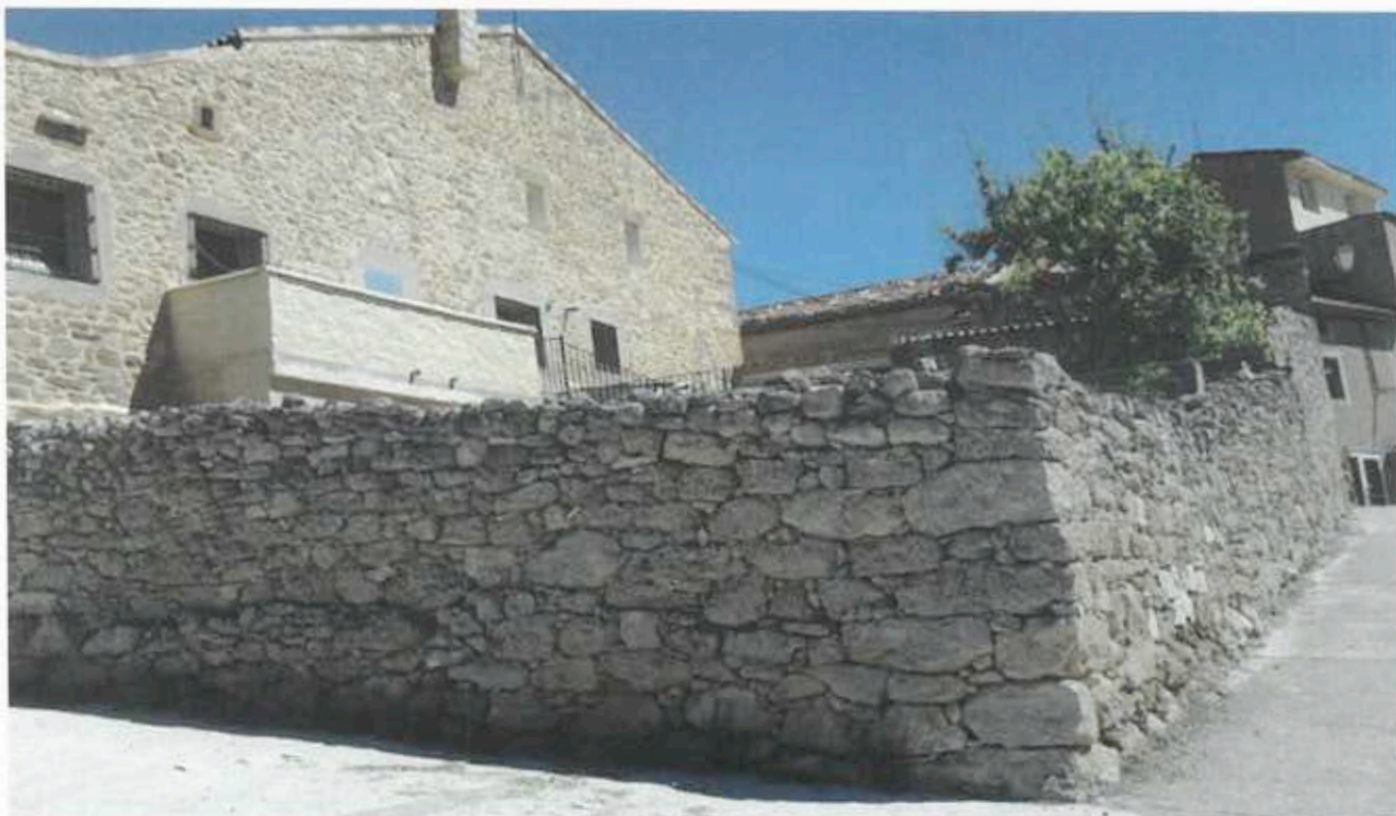
Solar del antiguo Hospital de Retortillo