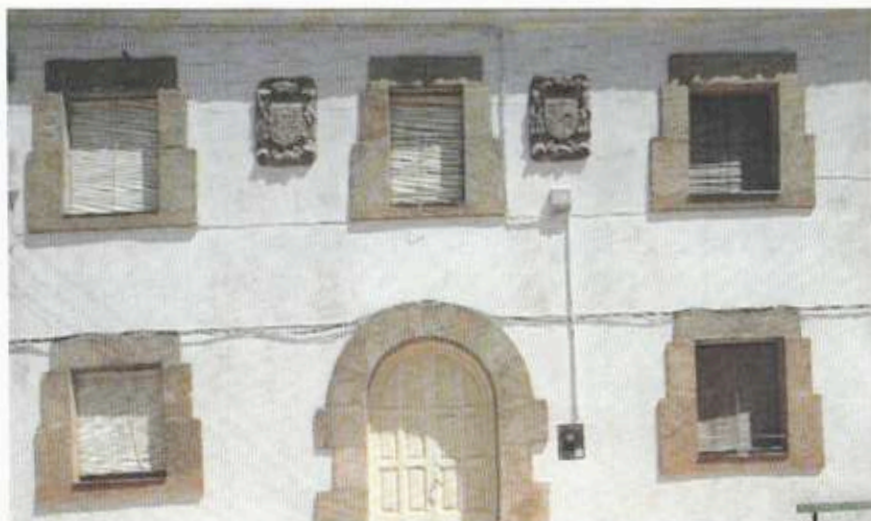
Antiguo hospital de Almazul