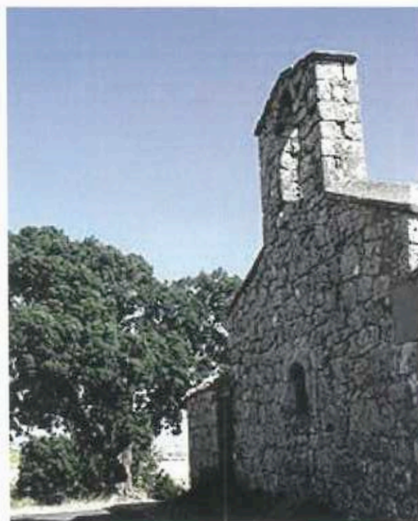
Cementerio de Adradas

* Estuvo situado junto al actual cementerio.