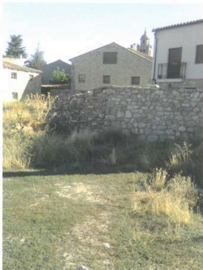
Hospital derruido. Último tercio del siglo XX