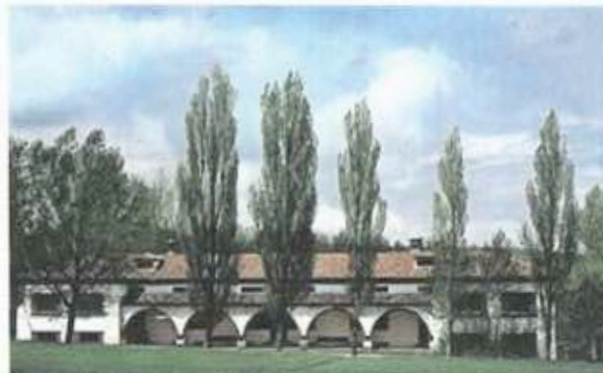
Hospital de Torralba ya derruido. Abajo residencia Virgen de la Luz, antiguo solar del Hospital