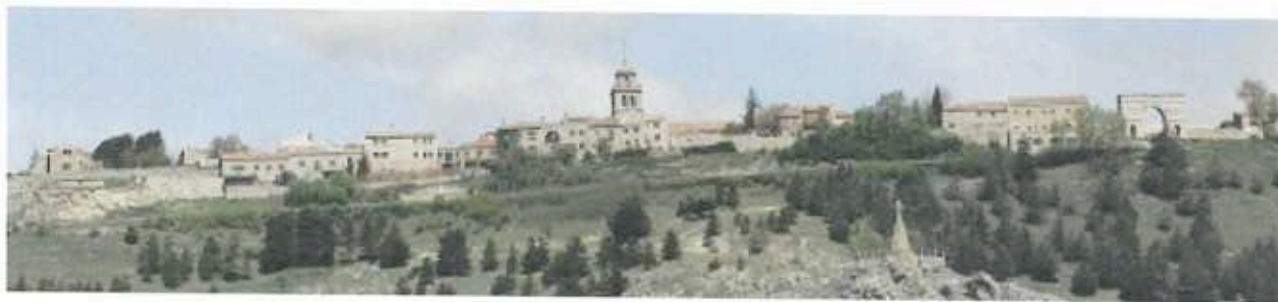
Vista parcial del pueblo de Medinaceli

Esta villa, dispuso de dos hospitales, uno para enfermos pobres, con habitación independiente para hospedar peregrinos desde la Edad Media hasta el último tercio del siglo XX y situado en la calle Hospital de Medinaceli (pueblo). Hoy abandonado y desaparecido.