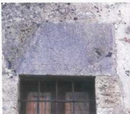
Inscripción en ventana y detalle sobre la puerta del Hospital