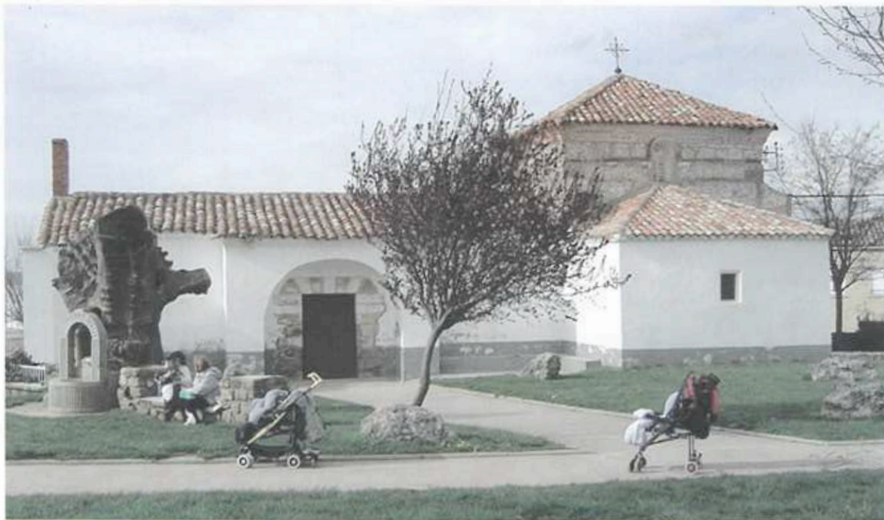
Ermita de San Roque

Ermita de San Roque. Está ubicada en un parque y sirvió en tiempos de epidemias como lazareto, al estar situada fuera del pueblo.