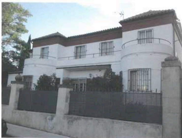
Distintas fotografías del Sanatorio del Pilar