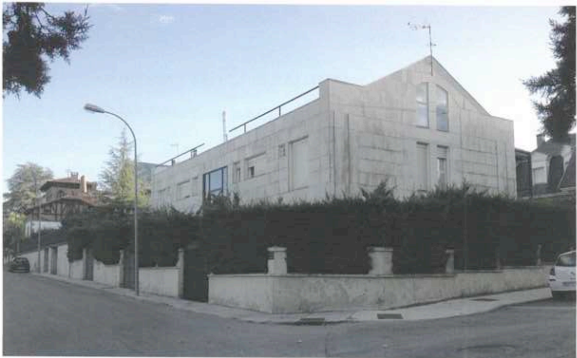
Solar de la antigua Clínica Mazariegos