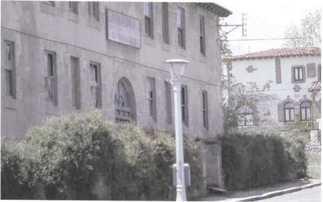
Edificio antiguo Sanatorio San Saturio