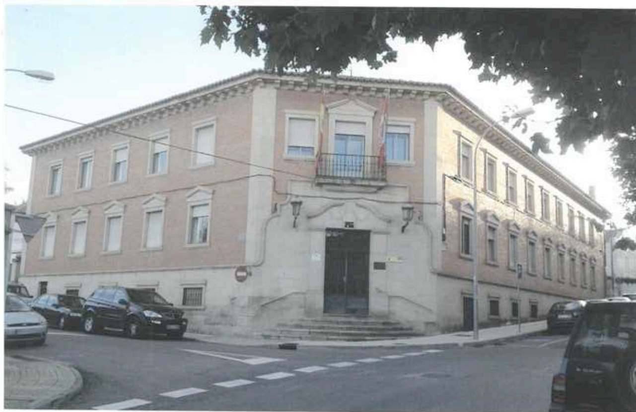
Clinica "Nonnata" Dr. Susín

La familia Susín había previsto realizar una nueva clínica que como tal construyó pero nunca llegó a habilitarse como Centro Sanitario (actualmente oficinas de Unidad de Agricultura del Estado y de Fomento del Estado y JCyL).